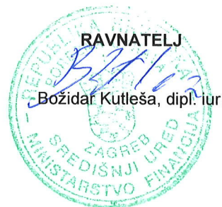
Božidar Kutleša, dipl. iur.

Dopušteno je odricanje od prava na žalbu od dana primitka ovog rješenja do dana isteka roka za izjavljivanje žalbe.